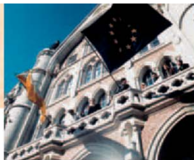
L'Université Catholique de Lille