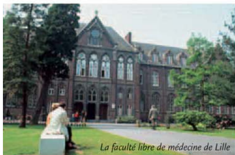
La faculté libre de médecine de Lille